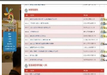
圖2.2-1:溫泉我的家獲獎