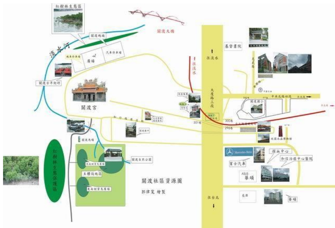
圖 1 關渡國小社區環境圖